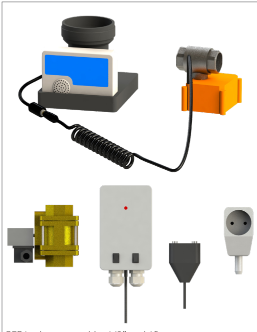
GEP Leckwassermelder 1/2" und 1"