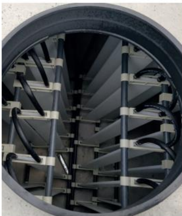
„Klimatank“ nennt sich das Wassersystem, für das das niederländische Unternehmen GEP Water BV kürzlich ein Patent erhalten hat.

Mit Hilfe von PVT-Modulen wird nicht nur Strom erzeugt, sondern auch der Außenluft Wärme entzogen. Die Steuerung der Anlage überwacht kontinuierlich den Temperaturverlauf in der Zisterne und führt bei Bedarf Wärmeenergie vom PVT-Kollektor zum Kühlkörper. Auf diese Weise wird verhindert, dass eine übermäßige Eisbildung in der Zisterne entsteht. Eine leichte Eisbildung jedoch steigert die Effizienz des Systems. Kühlt Wasser von 12 °C auf 11 °C ab, wird dabei eine Energie von 4.186 Joule freigesetzt. Kühlt dieses Wasser noch weiter auf 0 °C ab, d. h. in Richtung Eisbildung, kommt es zu einer Phasenänderung, die einen zusätzlichen Energieschub bewirkt. In diesem Moment beträgt die latente Wärme nicht weniger als 334.000 Joule. Diese Energiemenge reicht aus, um einen Liter Wasser von 0 °C auf ca. 80 °C zu erwärmen. Wenn das Steuerungssystem also zulässt, dass der Betriebspunkt des Systems im Winter sozusagen um diesen Erstarrungspunkt schwankt, kann eine relativ kleine Zisterne bereits eine hohe Effizienz bewirken. Das ist sozusagen ein „magischer“ Nebeneffekt der naturfreundlichen „Wasserbatterie“.