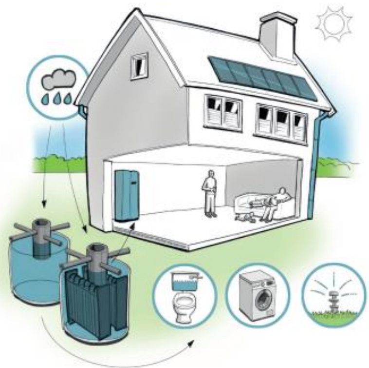
Das 2-Zisternen-System ermöglicht die Regenwassernutzung in Haus und Garten unabhängig von der thermischen Nutzung und bietet zusätzliches Retentionsvolumen.

Damit der Regenwasserspeicher die zusätzlichen energetischen Funktionen erfüllen kann, hat GEP im Vorfeld umfangreiche Untersuchungen durchgeführt und an mehreren Anlagen ausführlich getestet. Diese Erfahrungen sind in die Weiterentwicklung des Systems eingeflossen. Die Praxisphase hat gezeigt, dass an dunklen, kalten Wintertagen dem Kühlkörper so viel Energie entzogen wird, dass er über einen